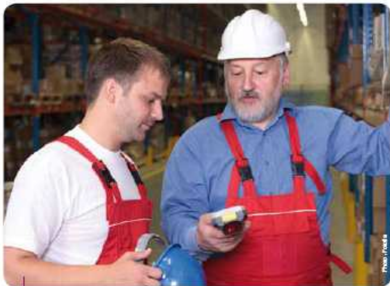
> PARMIS LES SITES CONCERNÉS PAR LE CTP : des bassins industriels comme la Franche-Comté ou la région de Compiègne.

Outils de reclassement et de reconversion des salariés licenciés économiques, le Contrat de transition professionnelle (CTP) et la Convention de reclassement personnalisé (CRP) ont connu une forte montée en puissance pendant la crise. Plutôt que de généraliser le CTP, on parle maintenant de fusion des deux dispositifs.